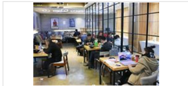
中関村のコーヒー店。著名経営者らの写真が飾られた店内に、ベンチャー起業家らが集まり事業アイデアを練ったりしている＝3月16日

ハイテクベンチャーでは広東省の深●（＝土へんに川）も日本で注目されるが、ハードウェア（機器）で強みがある深●（＝土へんに川）に対し、中関村はソフト面で強みがある。ベンチャー企業に資金を提供する投資家が多いのも中関村の特徴で、中国全土の毎年の創業投資の3分の1程度を中関村が占めるという。中国の起業家は「中関村こそハイテク産業の中心地だ」と指摘する。こういったハイテク産業の成長に注目してか、3月27日には金正恩氏も中関村を訪問。中国科学院の施設で展示会を視察した。